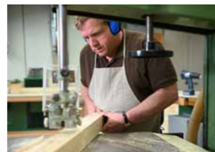
Schreinerei & Holzbearbeitung Gartenmöbel, Sonderpalettenbau, Säge-, Fräs-, Schleif-, Bohr- und Hobelarbeiten. Holz ist unsere Leidenschaft.