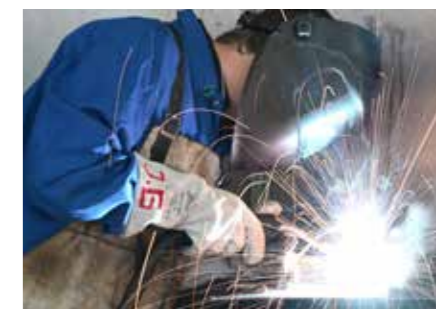
Schlosserei CNC-Bearbeitung, Sägen, Bohren, Drehen, Stanzen, Entgraten, Schweißen, Schleifen, Verzinken.