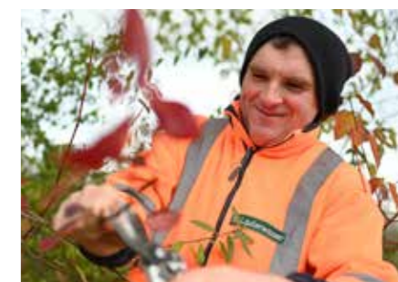
Landschaftspflege Wir pflegen Außenanlagen für den privaten und öffentlichen Bereich inkl. Rasen- und Heckenpflege.