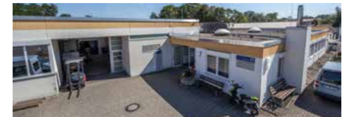
Niederlassung WG EHINGEN Katharinasteige 7, 89584 EHINGEN Tel.: 07391 77007-30 E-Mail: wg.ehingen@st-elisabeth-stiftung.de