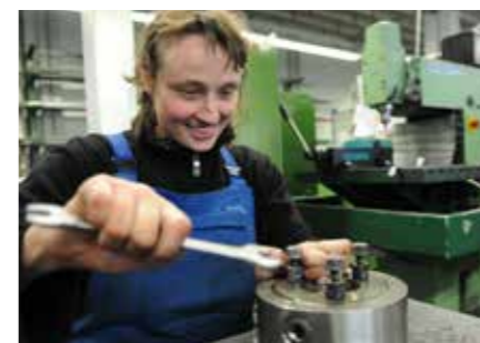
Montage Vormontage, Teilmontage und Komplettmontagen. Unser Montagebereich ist umfangreich und flexibel.