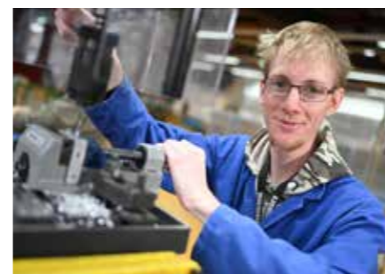
Metall- und Kunststoffverarbeitung Sägen, Bohren, Gewindeschneiden, Drehen, Schleifen, CNC-Bearbeitung, Stanzen - das können wir alles.