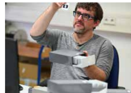
Digitalisierung, Datenarchivierung Digitalisierung und Archivierung von Filmen, Fotos, Dias und Dokumenten inkl. elektronische Ablagesysteme.