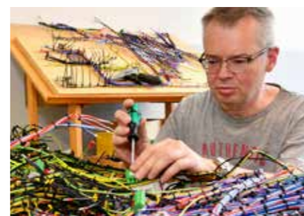
Kabelkonfektionierung Nach Maß verkabeln. Produktion von anschlussfertigen Kabeln, Kabelbündeln und Kabelbäumen.