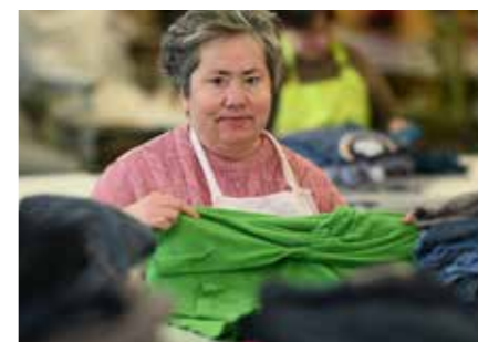
Textil Näharbeiten, Zuschnitte, Reparatur- und Flickarbeiten, Wäsche sortieren und legen.