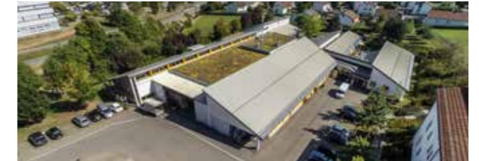
Niederlassung WfbM EHINGEN Breslauer Straße 24, 89584 EHINGEN Tel.: 07391 5806-30 E-Mail: wfbm.ehingen@st-elisabeth-stiftung.de