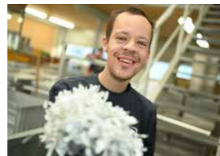
Akten- und Datenträgervernichtung Vernichtung und Entsorgung von Akten und digitalen Datenträgern gemäß Bundesdatenschutzbestimmungen.