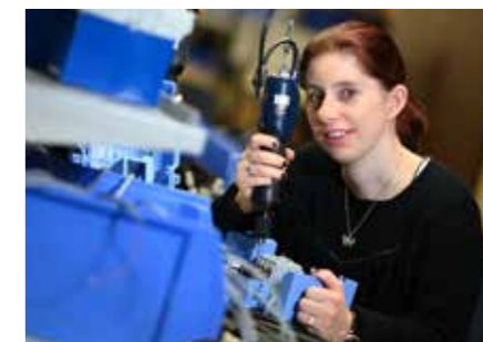
Elektromontage Bei uns springt der Funke über. Montage elektrischer Bauteile, Löten, Ablängen.