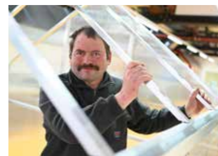
Gartenprodukte Gewächshäuser, Hoch- und Frühbeete, Komposter sowie Produkte aus Holz: Gartenmöbel, Nist- und Futterkästen.