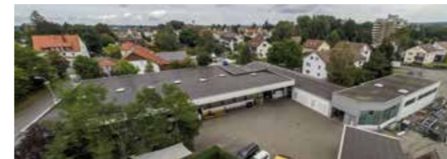
Niederlassung WG Bad Buchau Schussenrieder Straße 75, 88422 Bad Buchau Tel.: 07582 9306-30 E-Mail: wg.badbuchau@st-elisabeth-stiftung.de