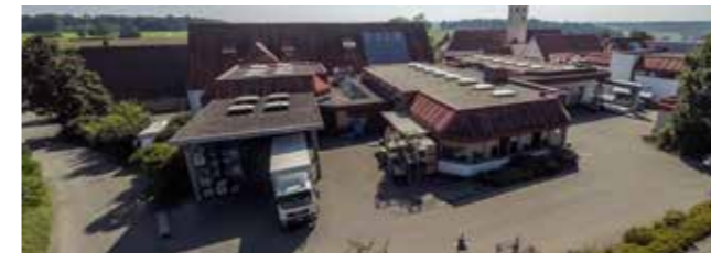
Niederlassung WfbM Heggbach Heggbach 2, 88437 Maselheim Tel.: 07353 81-170 E-Mail: wfbm.heggbach@st-elisabeth-stiftung.de