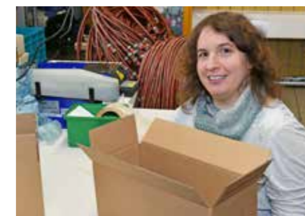
Verpackungen Bei uns geht die Post ab. Kommissionieren, Konfektionieren, Abfüllen, Sortieren, Kuvertieren.